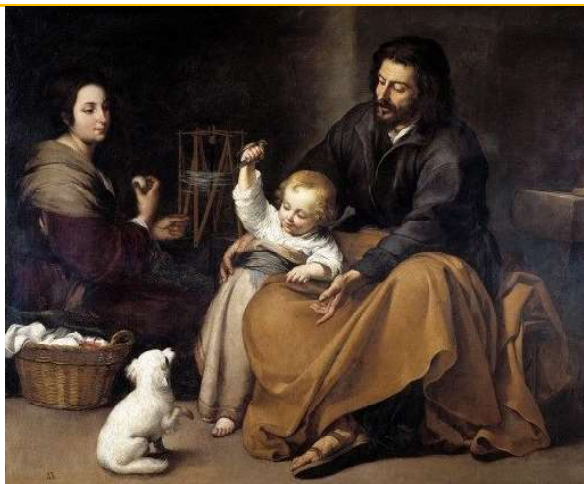
Bartolomé Esteban Murillo: „Šventoji šeima interjere“

Šiandienos šventė demonstruoja Kristaus nusizeminimą ir paklusnumą bei pagarbą ketvirtajam Dievo įsakymui, tuo pačiu pabrėždamas mylintį Jo tėvų rūpestį, pasireiškiantį Jo globoje. Palaimintasis popiežius Jonas Paulius II 1989 m. išleido Apaštališkąjį paraginimą Redemptoris Custos (Išganytojo globėjas), kuris buvo skirtas šventojo Juozapo asmenybei ir misijai Kristaus ir Bažnyčios gyvenime. Praėjus šimtmečiui jis reziumavo popiežiaus Leono XIII mokymą, kuriam šv. Juozapas „šviečia virš visos žmonijos savo didingu orumu, nes per dieviškąją valią jis tapo Dievo sūnaus globėju ir buvo Jo tėvas tarp žmonių.“ Popiežius Leonas XIII tęsė: „Juozapas tapo globėju ir oficialiu dieviškų namų gynėju ir galva. Todėl verta ir natūralu, kad kaip jis tarnavo visiems šeimos poreikiams Nazarete ir gaubė ją savo apsauga,